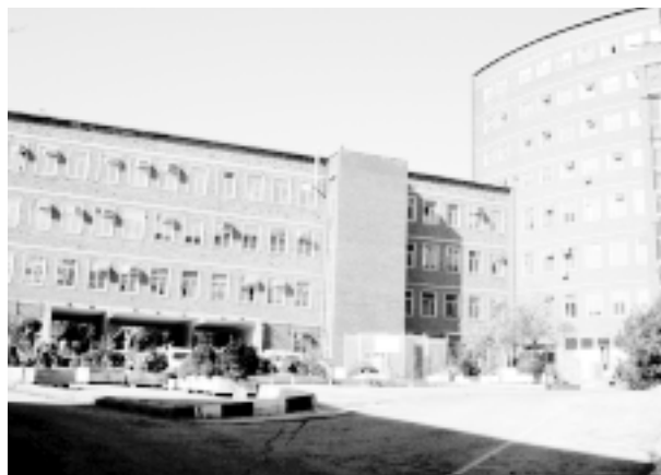
Segundo Instituto Cajal, hoy «Centro de Investigaciones Biológicas».

Esta ciudad ha excedido ya de modo intolerable los límites de su desinterés por Cajal; su deuda no se substanciará con hacerle simplemente ahora su hijo adoptivo ni con llenar de placas cada laboratorio que creó, aunque esto también hay que hacerlo. El sesquicentenario de Cajal está en su ocaso y el hombre de la calle no ha tenido ocasión de percibirlo, mientras sabía a diario de los homenajes a Gaudí, su coetáneo (y un inmenso arquitecto que, sin embargo, no puede medirse con Cajal); la comparación de actitudes ciudadanas solo sirve para aumentar el respeto que Barcelona merece.