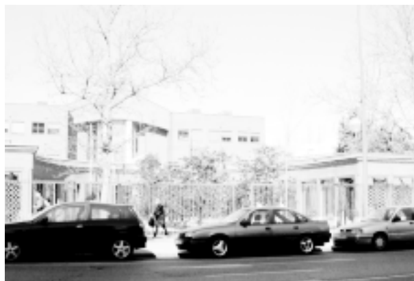
Actual Instituto Cajal. Telefónica lo desconoce.

Primer objetivo: el Museo. Convertir el Legado Cajal en un espléndido Museo, abierto a la admiración de todos, y a la investigación de quienes estén capacitados para hacerla, es una prioridad absoluta. Alcanzar esa meta es la pri-