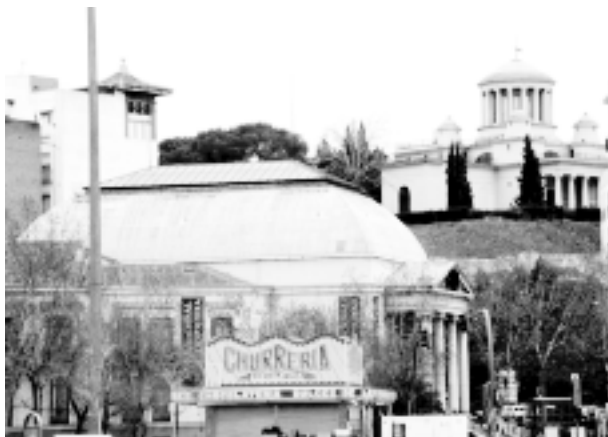
El museo Velasco, en una cuyas alas residió el Laboratorio, luego Instituto, y, unos metros más allá, en lo alto del cerro de San Blas, el Observatorio, a cuyo lado se edificó el primer Instituto Cajal diseñado como tal.

El Museo de Etnología (o del Dr. Velasco), en cuya planta principal del ala que encara la Estación del Mediodía, llamada desde 1901 Instituto de Investigaciones Biológicas, trabajó durante treinta años, no sólo no conserva su laboratorio y su despacho, trasladados en 1932 al recién estrenado Instituto Cajal, sino que ignora en su fachada que allí se hizo la más relevante aportación de la ciencia española. Y si pregunta uno en la entrada nadie sabe de qué le están hablando.