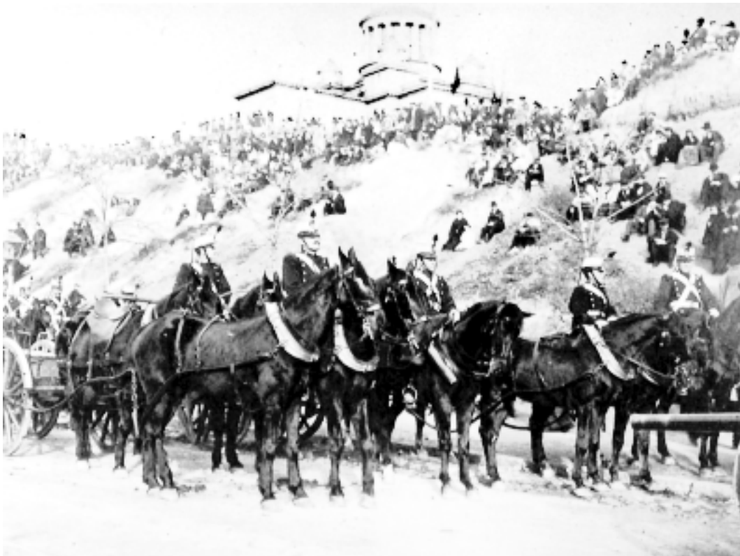
Poco antes de que la presencia de Cajal convirtiese esta zona de Madrid en centro de la Neurohistología mundial