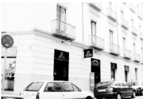
Atocha 42, otro domicilio de Cajal.