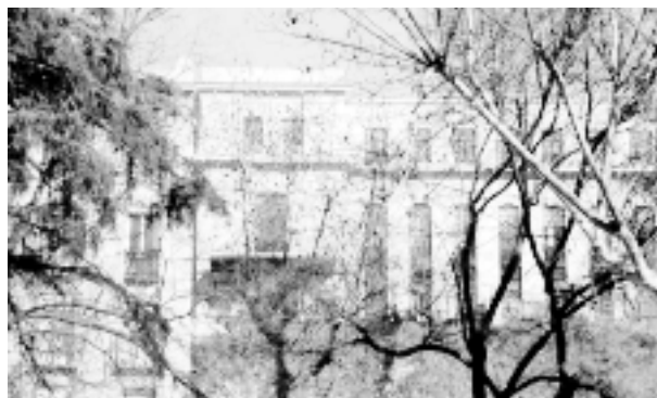
El monumental edificio diseñado como primer Instituto Cajal, que se tardó más de diez años en construir y hoy es una Escuela de Obras Públicas. En lo alto de una colina pero casi oculto por los edificios a sus pies y los árboles del paseo, lo mató su inmanejable grandiosidad. Desde aquí no es accesible.

Madrid, sus gentes, sus instituciones y las Instituciones nacionales que en Madrid radican deben a Cajal un Homenaje vivo y permanente, cuya realización hará más justicia a quienes la lleven a cabo que al propio homenajeado, y que no es tan difícil. Todo lo material ya existe en su parte más importante: el Museo tiene lo que no se podría inventar: el riquísimo conjunto de los materiales salidos de la mano de Cajal, con sus medallas y títulos. La Cátedra, con un dispendio muy modesto, podría comenzar a funcionar en un año. Y el Itinerario, con diez placas, un mínimo de documentación y ganas, podría estar listo