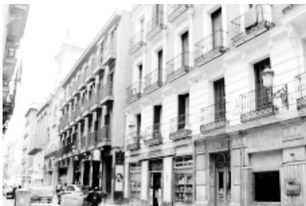
En el primer edificio a la derecha, Príncipe esquina a Huertas, recibió Cajal el telegrama con la concesión del Nobel.

Y por último el Itinerario. Además del silencioso trabajo de los investigadores en la respetuosa penumbra del Museo, y de la atención devota de los médicos en la Cátedra, hay que devolver a Cajal al roce de las gentes madrileñas, que tuvieron siempre para él una hermosa mezcla de respeto y amor.