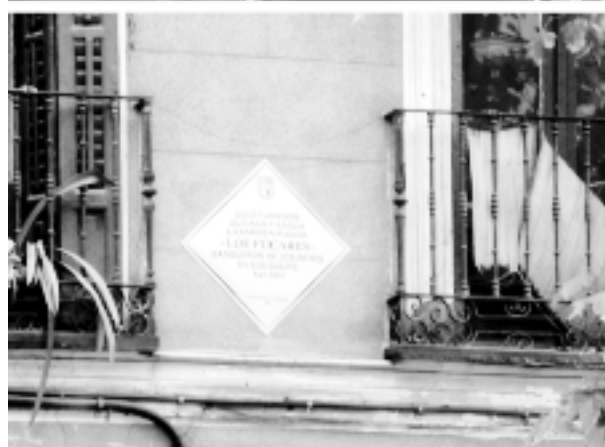
La otra casa en Atocha, frente a su Facultad, en la que vivió Cajal. La Placa recuerda a unos banqueros.