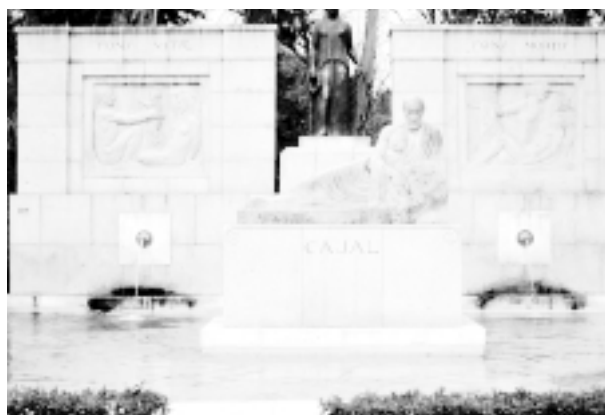
Este hermoso grupo escultórico, cerca del estanque grande del Retiro, merece cerrar el itinerario devoto por las huellas de Cajal.