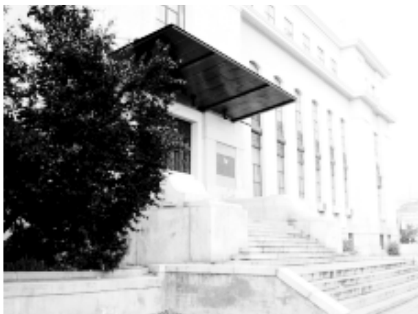
Primer edificio diseñado para Instituto Cajal, construido de 1920 a 1933 y en funcionamiento hasta los años 50.

Para la mayor sorpresa de quien pueda interesarse por todo esto un panfleto de este museo titulado « Un templo a la Ciencia. Historia del Museo Nacional de Etnología » ni siquiera menciona a Cajal.