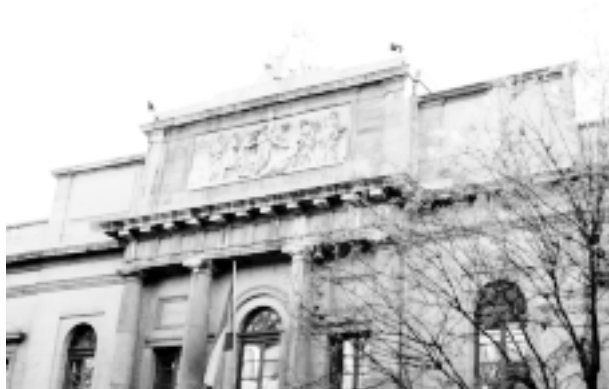
Antigua Facultad de Medicina de San Carlos.

La calle de Atocha que pateó durante tantos años, y en la que tuvo varias casas le ignora por completo; ni siquiera el viejo San Carlos, al que dio más prestigio que todos los demás médicos juntos, tiene una placa con su nombre en la entrada principal; y en su jardín, hasta hace muy poco, permaneció su más antigua estatua con la noble faz mutilada.