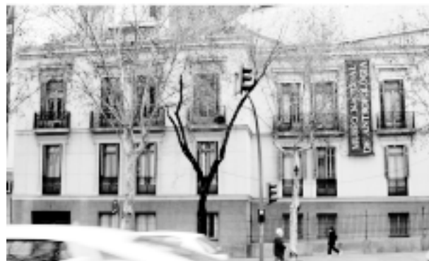
Laboratorio de Investigaciones Biológicas, 1901-1933 (primer Instituto Cajal desde 1920).